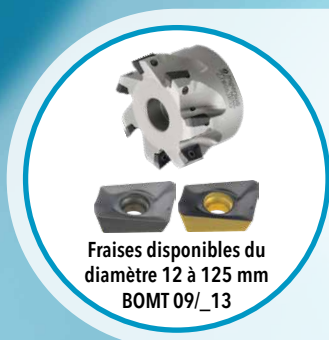
Fraises disponibles du diamètre 12 à 125 mm BOMT 09/_13