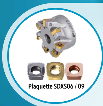
Plaquette SDXS06 / 09